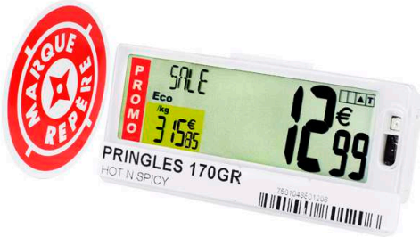
Pricer SmartTAG™ Mediana E5 con SmartCLIP