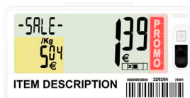
Pricer SmartTAG™ Mediana E4

Moneda: $ SALE / # for / UNIT PRICE / alfanumérico