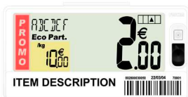
Pricer SmartTAG™ Mediana E5

Monedas: € $ Kr r £ PROMO / alfanumérico