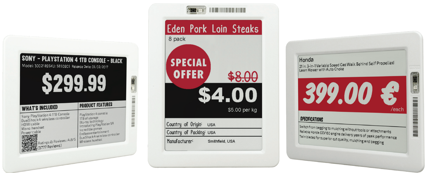
SmartTAG HD 150 B/W y B/W/Red