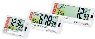
SmartTAG Small, Medium, Large

Gracias a las etiquetas SmartTAG de Pricer, los precios de su tienda aparecerán de una forma clara, podrán leerse con facilidad y siempre serán fiables. Las etiquetas SmartTAG de Pricer dotarán a su tienda de una fuerte capacidad de promoción y mejorarán la experiencia de sus clientes.