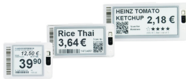
SmartTAG HD Small, Medium +, Large