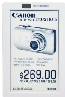
SmartTAG HD200 Slim